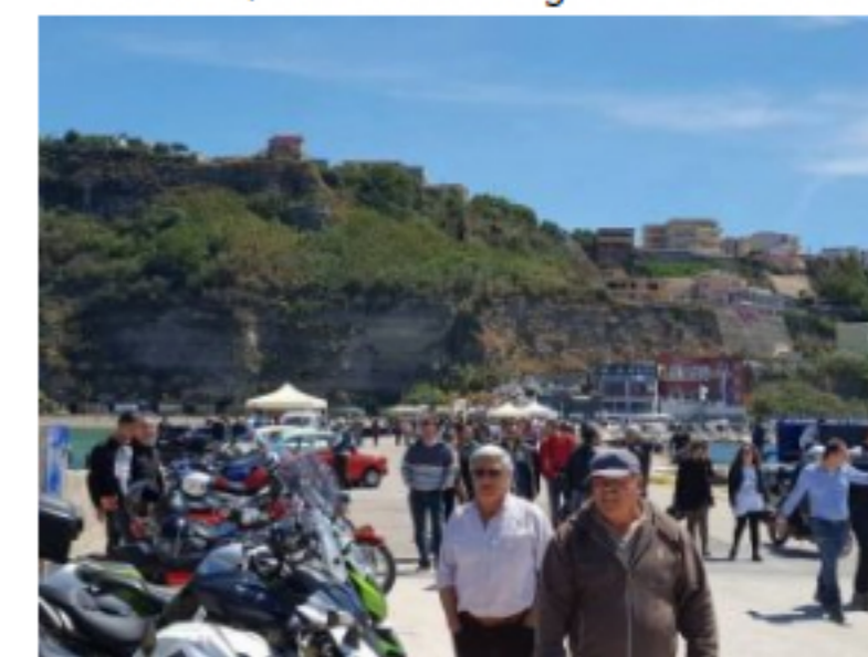
Buona la prima del Mare Motor Fest